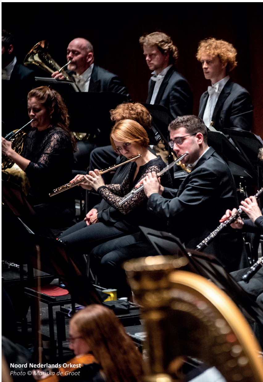
Noord Nederlands Orkest