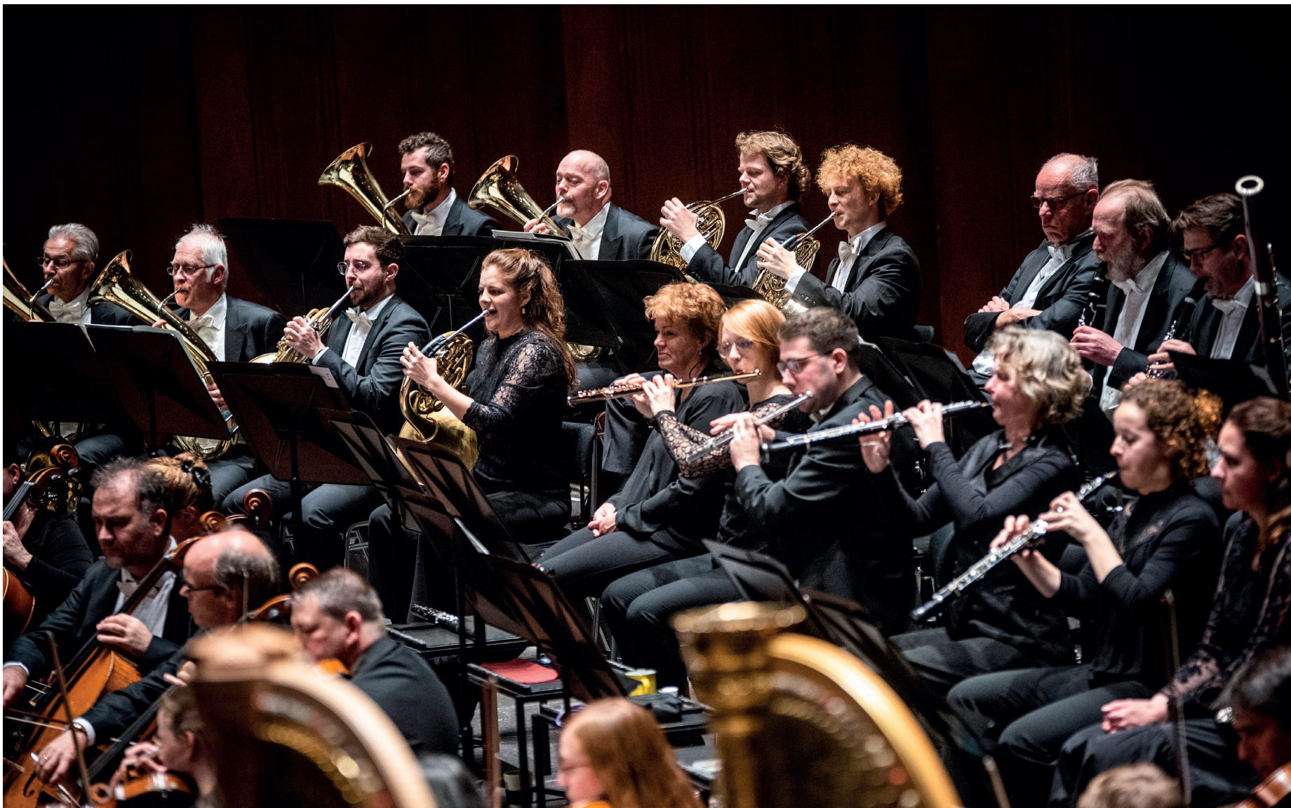
Noord Nederlands Orkest